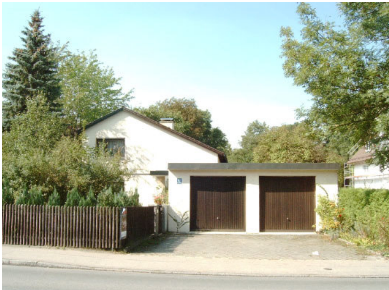
Der Neubau auf dem Hausgrund des "Maurergaberl": Eversbuschstraße 13

noch: Untermenzing 1812 Haus Nr. 7: Maurergaberl