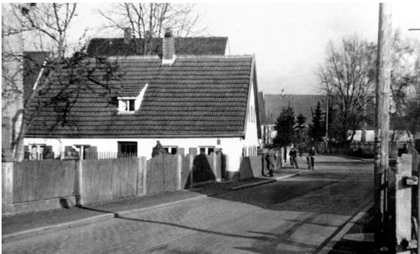
Der "Maurergaberl" um 1965