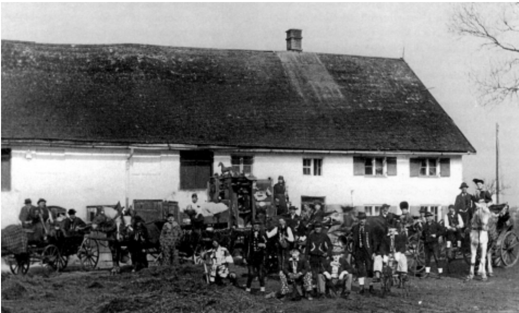
Faschingstreiben 1925 auf dem Grandl-Hof Ansicht von Osten

noch: Untermenzing 1812 Haus Nr. 1: Grandl