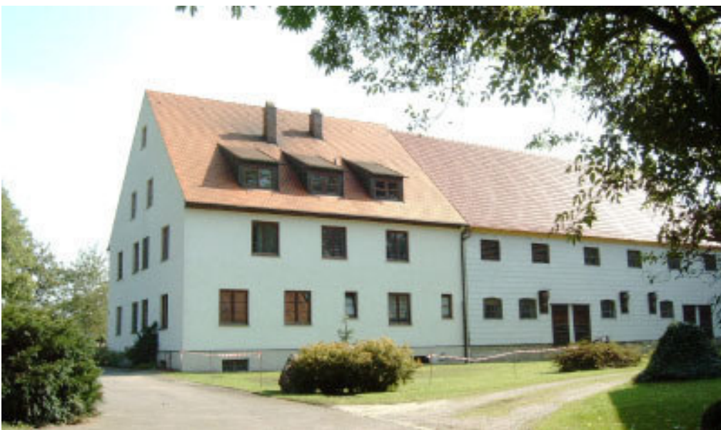
Grandl-Hof in der Ansicht von Nordwesten